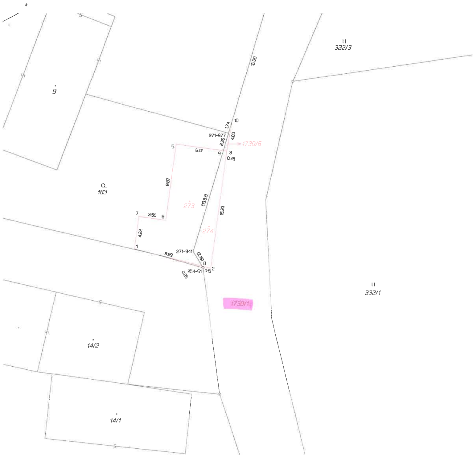
Seznam souřadnic (S-JTSK) Číslo bodu Souřadnice pro zápis do KN Y X Kód kv. Poznámka